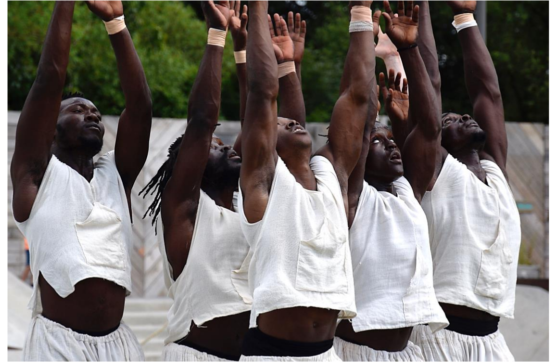
Première FA - Espace public - Zomer van Antwerpen juillet 2022